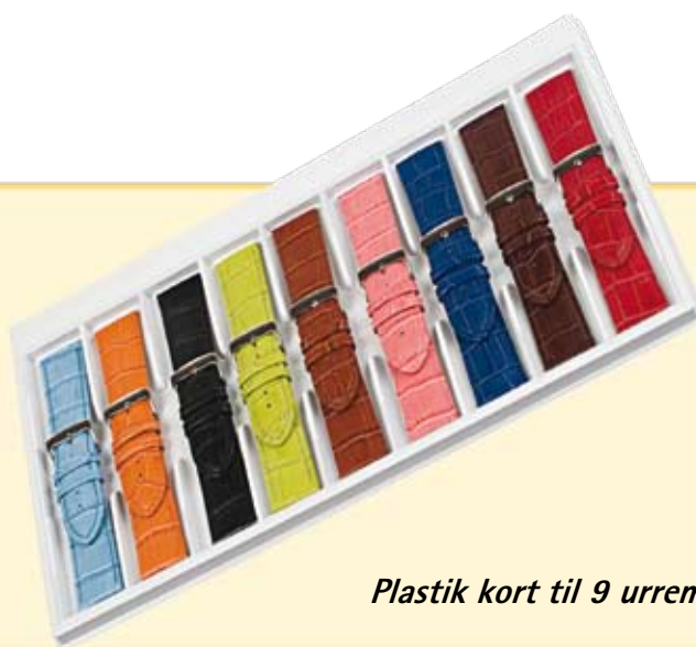
Plastik kort til 9 urremme 24 - 30 mm